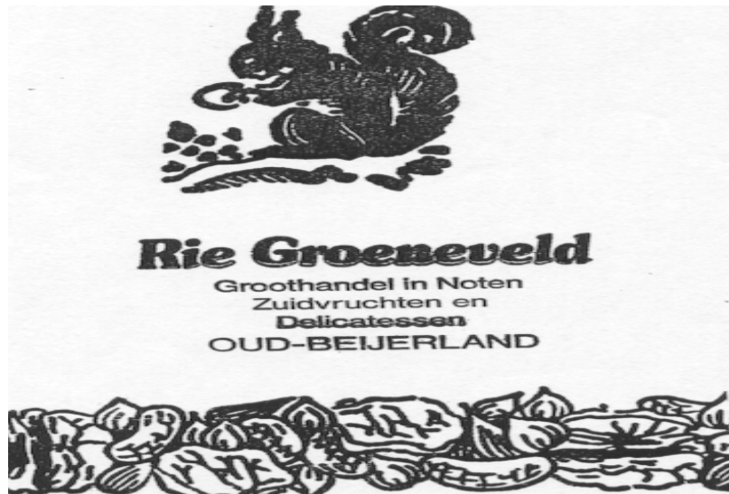
Vrijdagmorgen op de markt tegenover Blokker